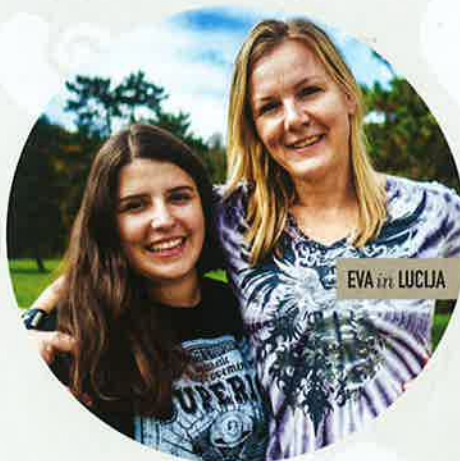
EVA in LUCIJA

"Tako sem pomislil: 'Ta pa je postaven!'"