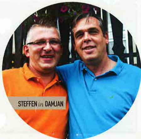
STEFFEN in DAMJAN

"Nora" sem. In tudi ona je "nora". Včasih pride Kupid, v očeh je iskrenost, na obrazu je lepota, pa se že brez preprek zavrtiva v ples ljubezni, ki ti spremeni življenje."