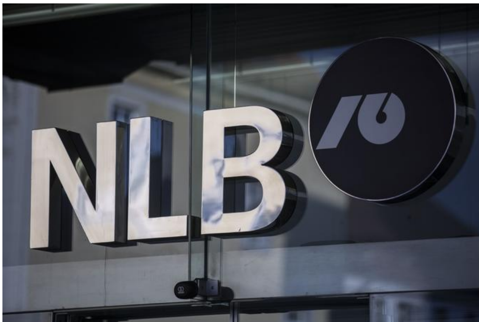
Kriminalisti so obiskali tudi NLB. Poglejmo dejstva in številke v primeru NLB: