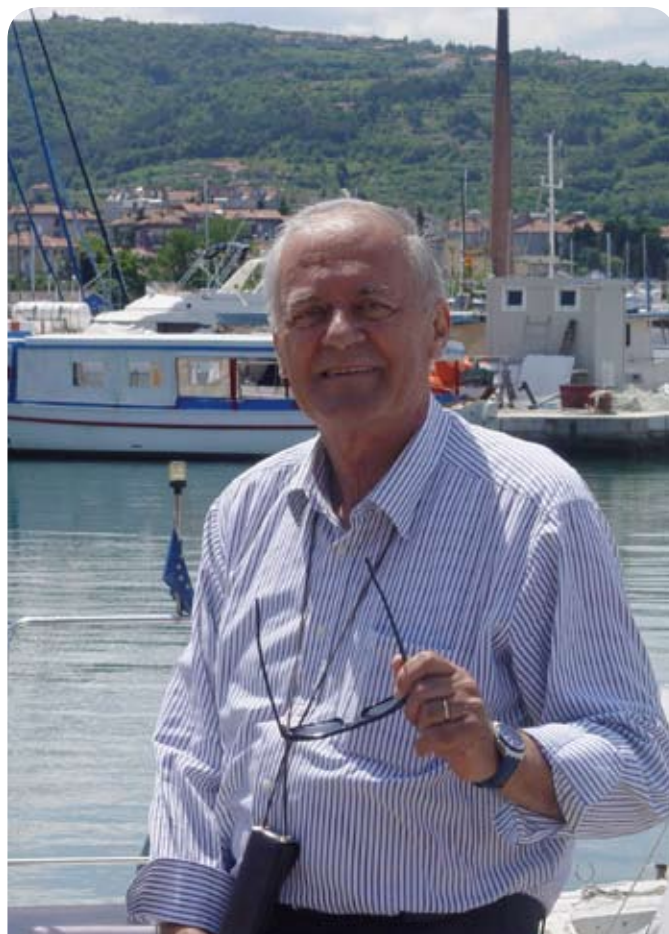
Sprehod ob morju

Ponosen je na Festival seniorjev in seniork SDS, ki bo letos organiziran prvič in sicer 19. julija v Domžalah. Zbrali se bodo seniorji iz vse Slovenije, zato prisrčno povabljeni, da se nam pridružite.