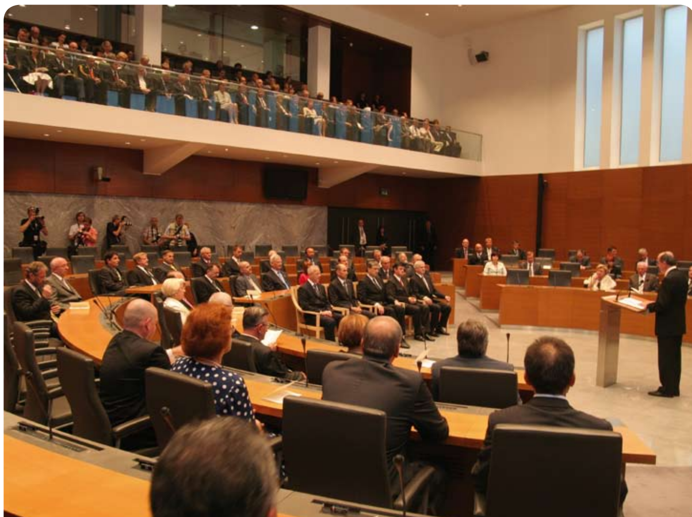
Predsednik Državnega zbora na slavnostni seji