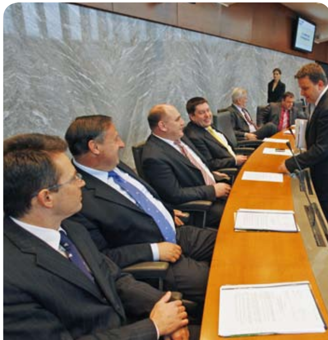
Poslanci SDS med kratkim posvetom v veliki dvorani