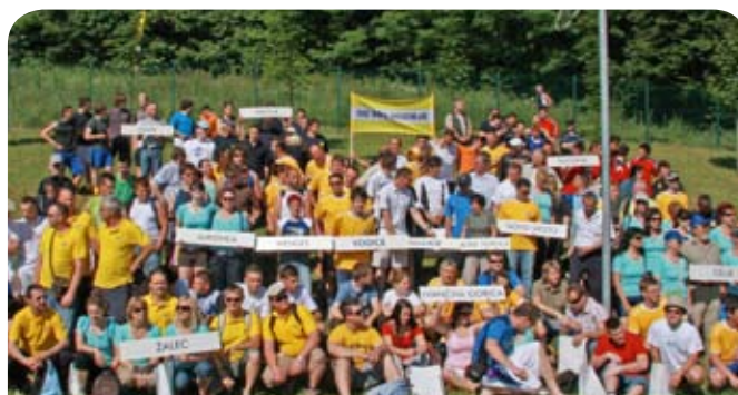
Tukaj smo pa skoraj vsi. Se najdeš?