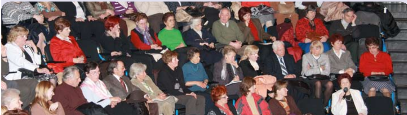
Udeleženci javne tribune so pozorno prisluhnili razpravi o podnebnih spremembah

K vsebinsko kvalitetni in živahni diskusiji so s svojimi vprašanji in mnenji doprinesli tudi številni poslušalci. Bistveno pa ostaja sporočilo: narava je odvisna tudi od ravnanja vsakega posameznika.