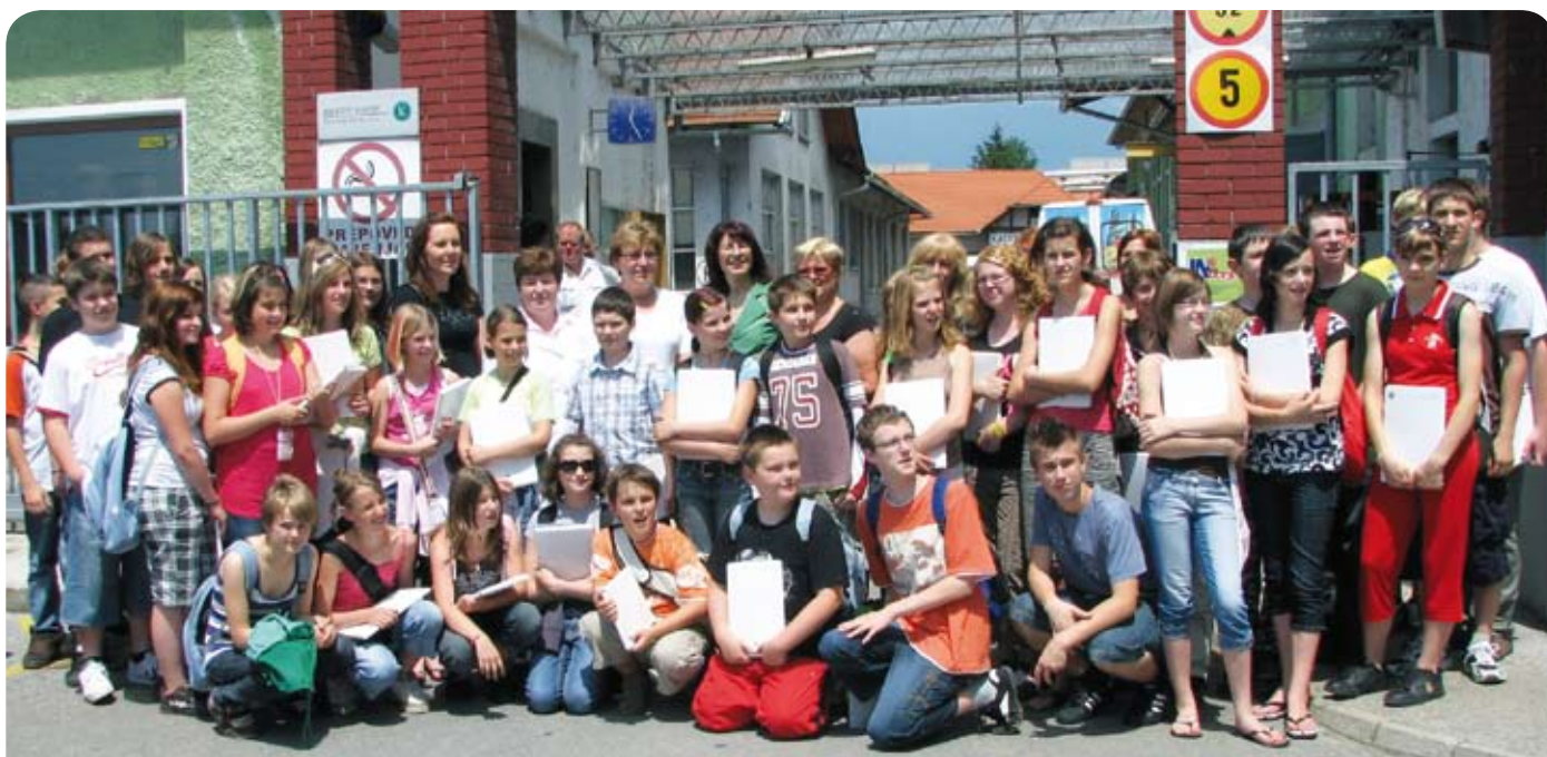
Številni otroci so si ogledali celoten postopek izdelave papirja