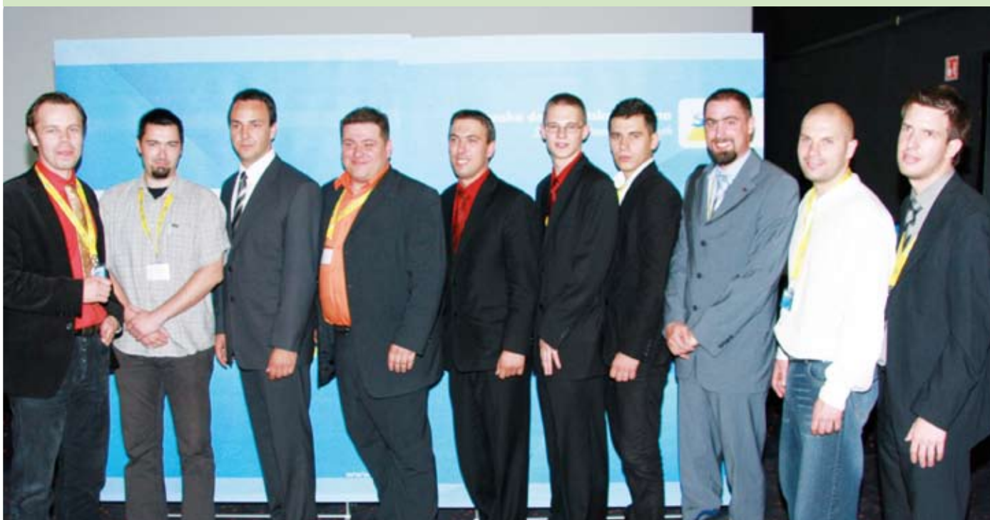
Nova ekipa SDM