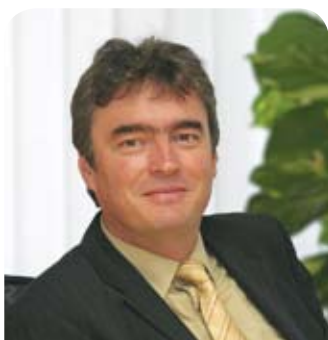
dr. Milan Zver