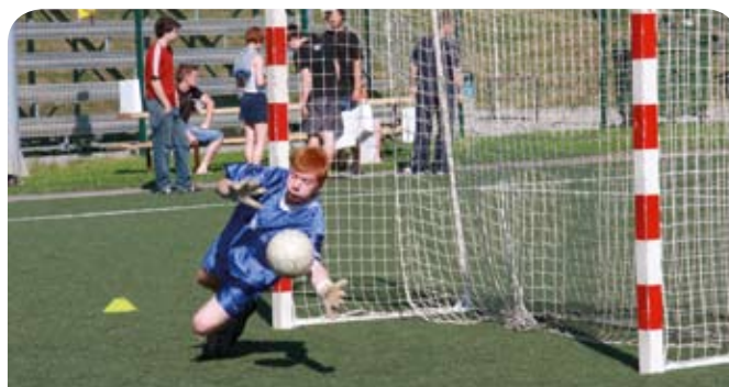
Žoga, ne bo ti uspelo.