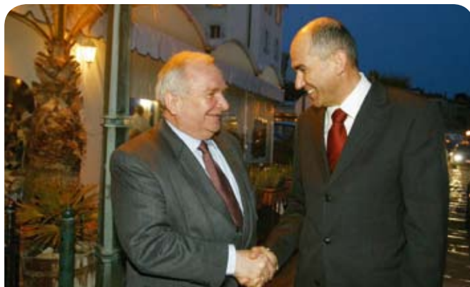
Predsednik SDS Janez Janša in vodja poslanske skupine EPP-ED Joseph Daul na vrhu poslanske skupine EPP-ED