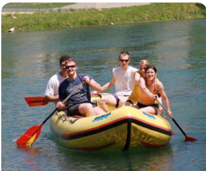
Krka je pa res super!